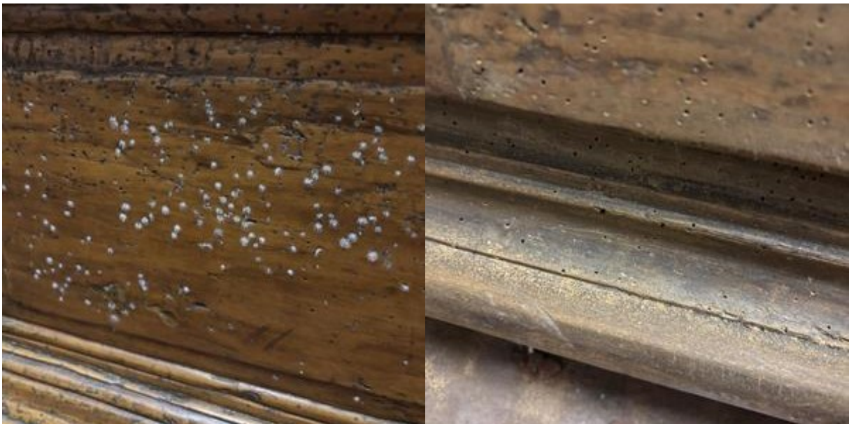
Bild 3: Schimmelbefall sowie Ausfluglöcher holzerstörender Insekten an historischen Möbelstücken

Holzerstörende Insekten beschränken sich dabei nicht nur auf Bauholz. Auch andere hölzerne Gegenstände und sogar Bücher können befallen werden. Wie im folgenden Schadenfall, bei dem wir in einem Museum historische Möbel im Hinblick auf einen Schimmelbefall untersuchten und dabei als Nebenbefund auch einen Befall durch holzerstörende Insekten feststellten (Bild 3).